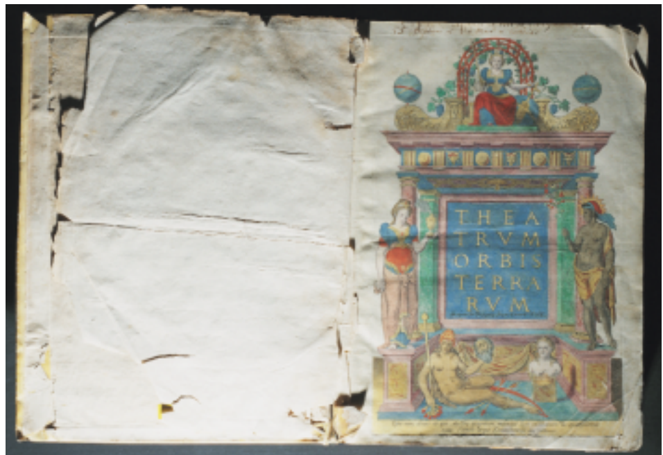
Mechanische Schäden am Einband und Buchblock, Karten mit Kupferfraß

Das »Theatrum orbis terrarum« des Kartographen und Altertumswissenschaftlers Abraham Ortelius (Oertel, Ortels; 1527–1595) ist als erster Verlegeratlas für die Geschichte der Kartographie von besonderer Wichtigkeit. Es erschien erstmalig 1570 in Antwerpen und enthielt 53 Karten, die Ortelius größtenteils nach fremden Vorlagen überarbeitet hatte. Die zweite Auflage, zu der auch das Marburger Exemplar gehört, hatte bereits 70 Karten; bis zur letzten Ausgabe von 1608 steigerte sich der Umfang auf 166 Karten. Insgesamt erlebte das Werk, das von vornherein auf Breitenwirkung angelegt war, etwa 40 Ausgaben.