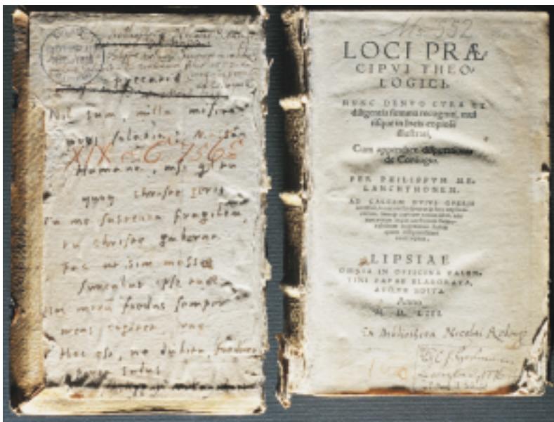
Mechanische Schäden am Einband und Buchblock, u. a. am Autograph Philipp Melanchthons