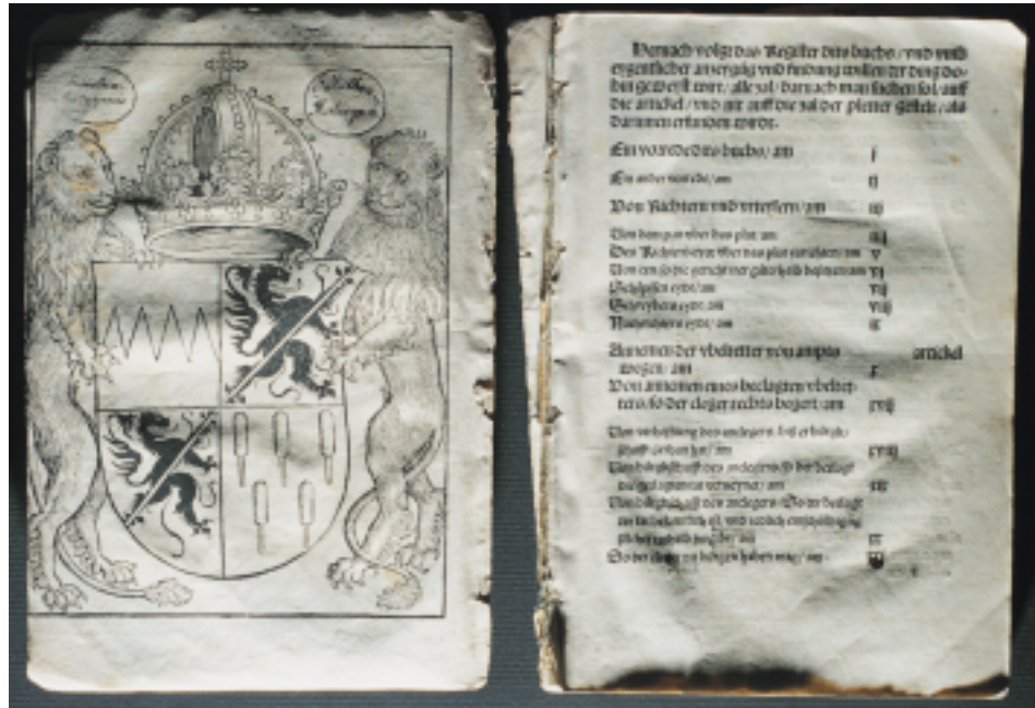
Mechanische Schäden am Einband und Buchblock

Bambergische halsgerichts ordenu(n)g. [Bl. lxxx r:] Bamberg: Hanns Pfreyll 1507. [8]