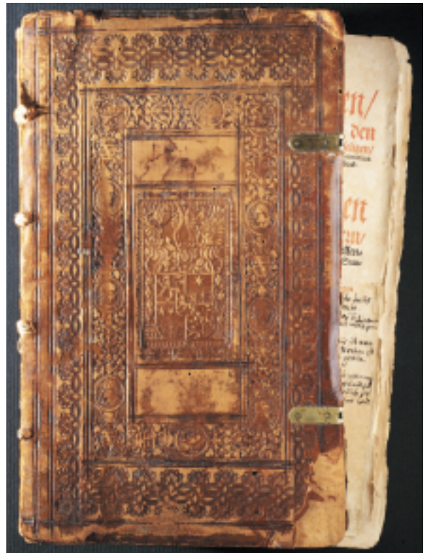
Mechanische Schäden am Einband und Buchblock