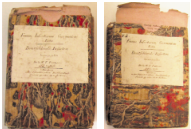
Stark angestaubte Schutzschuber und Papierränder