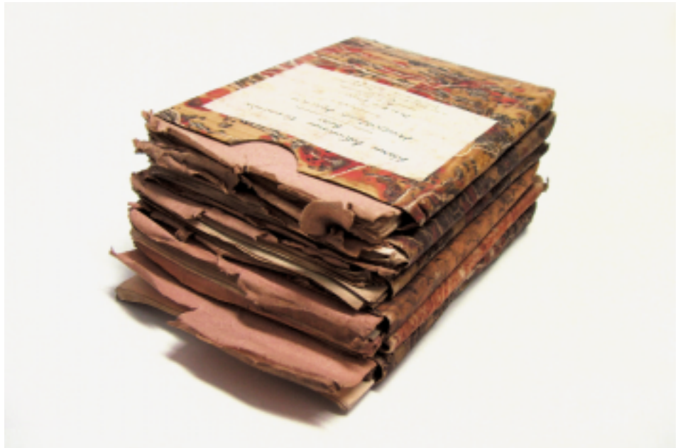
Leichte bis mittelstarke Einrisse der einzelnen Seiten