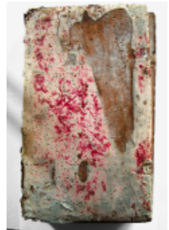
Massive Einbandschäden, Schließenergänzung notwendig